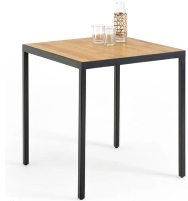
1 table Dimension max : 100 x 100 cm