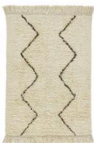
1 tapis Dimension max : 120 x 60 cm