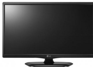
1 télévision Dimension max : 32"