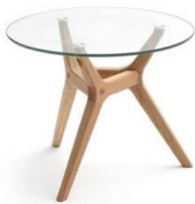
1 table de chevet