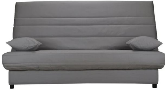
1 Canapé-lit (type BZ ou clic-clac selon arrivage)

A savoir : Photos non-contractuelles Photos et descriptifs donnés à titre indicatif. Style contemporain et harmonieux garanti. Marques d'usure invisibles à plus d'1 mètre