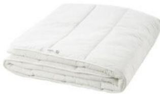
2 couettes 2 places (neuves)