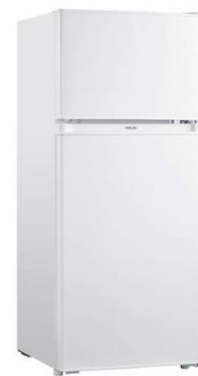
1 réfrigérateur haut + 150€ TTC