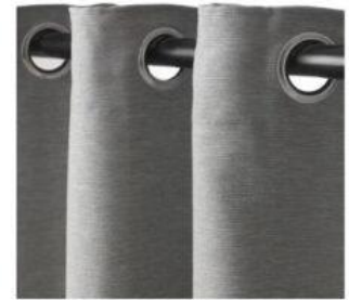
1 paire de rideaux occultants neufs + 1 tringle à rideaux neuve