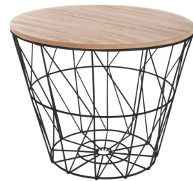
1 table basse

Option Déco : Cadres + coussins +45€ TTC en seconde-main