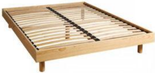
1 sommier avec pieds

A savoir : Photos non-contractuelles Photos et descriptifs donnés à titre indicatif. Style contemporain et harmonieux garanti. Marques d'usure invisibles à plus d'1 mètre