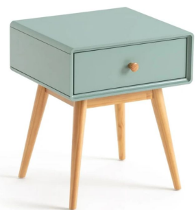
2 tables de chevet