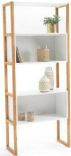
1 étagère haute