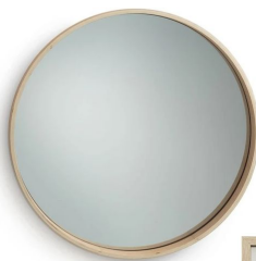
2 articles de déco (cadre ou miroir)

Option Déco : Cadres + coussins +45€ TTC en seconde-main