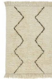
1 tapis Dimension max : 120 x 60 cm