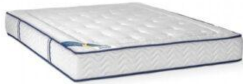
1 matelas mousse (état propre)