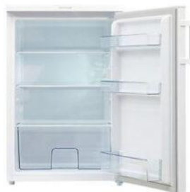
1 réfrigérateur bas + 120€ TTC