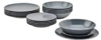
1 set de vaisselle neuve (4 grandes assiettes, 4 assiettes creuses, 4 petites assiettes, 4 verres, 4 couteaux, 4 fourchettes, 4 cuillères) + 1 casserole, 1 poêle