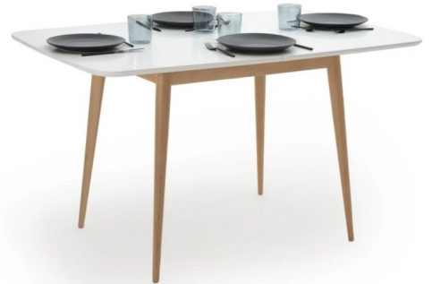
1 table pour 4 personnes