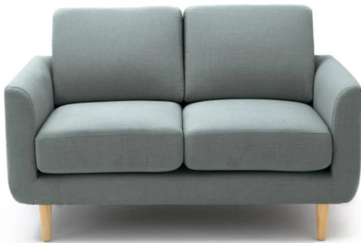
1 canapé 2 places