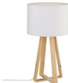
2 lampes de chevet