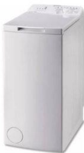
1 machine à laver ouverture sur le haut + 150€ TTC