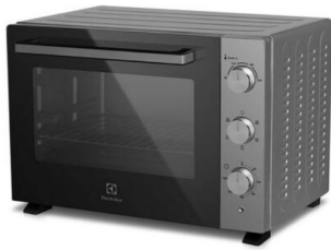
1 mini-four à poser

A savoir : Photos non-contractuelles Photos et descriptifs donnés à titre indicatif. Style contemporain et harmonieux garanti. Marques d'usure invisibles à plus d'1 mètre