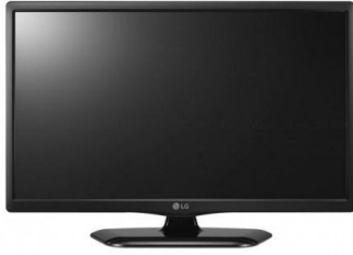
1 télévision Dimension max : 32"

A savoir : Photos non-contractuelles Photos et descriptifs donnés à titre indicatif. Style contemporain et harmonieux garanti. Marques d'usure invisibles à plus d'1 mètre