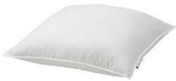
2 oreillers (neufs)