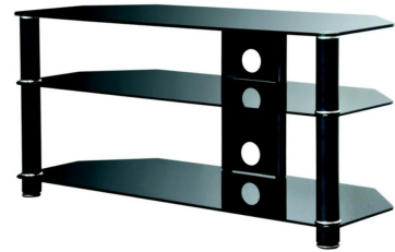
1 meuble TV bas